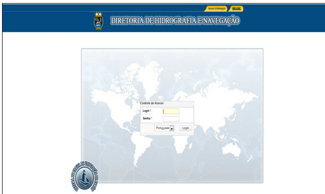
Figura – Tela de Acesso

Caso não possua um login, o usuário deve entrar em contato com o administrador para solicitá-la.